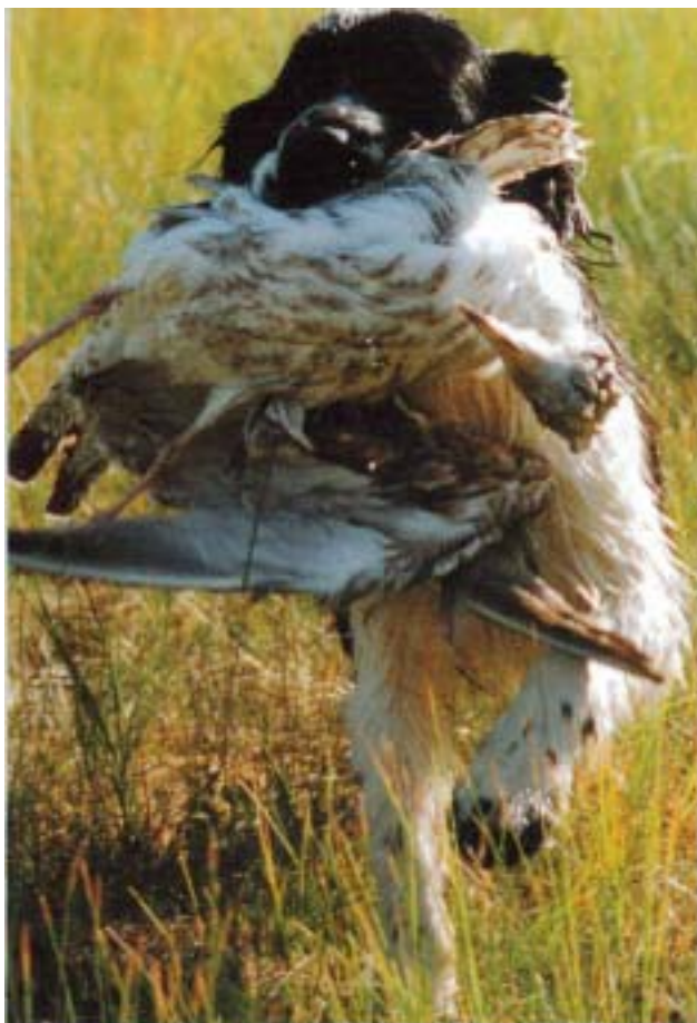
Det är springerns rastypiska jakttegenskaper som gör den så väl ägnad som spårhund, sökhund, lydriad och agility och som familjehund och promenadkamrat.

Många av dagens springer, oavsett linjer, har dessa rastypiska bruksegenskaper. Många används till jakt, men ännu fler är det som har fått nya uppgifter. Om du vill ha en allsidig, arbetsvillig, livlig och social hund som inte är rädd, som håller sig till huset och som inte sticker bygden runt så fort den är lös, som går ihop med barn, hundar och andra husdjur, som inte har ett starkt försvar, som inte är för platskrävande varken i huset eller i bilen och som är lätt nog att kunna lyftas och som kan användas till det mesta från agility, lydriad, blodspår, eftersök, småviltsjakt och brukshundsarbete - då är springer en ras du bör titta närmare på. Men för att kunna trivas med rasen måste du vilja ha en hund som följer dig där du är, också i huset, som inte gillar att stå ensam i en hundgård, som det måste spenderas tid på både