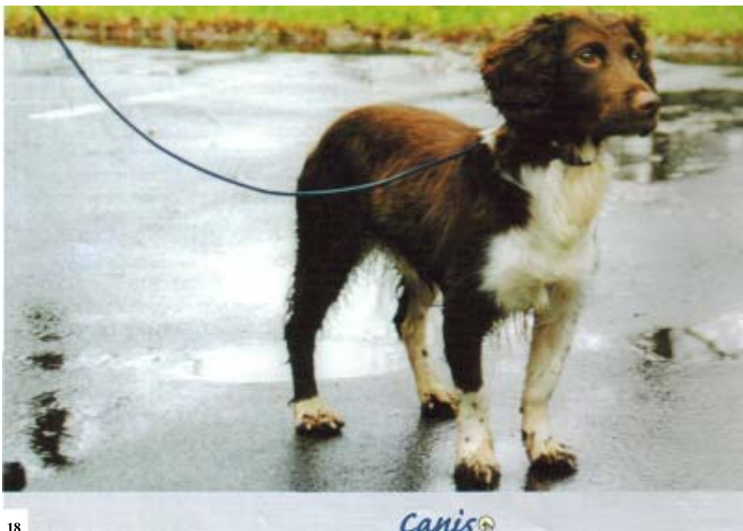
En working springer är en springer från rena jaktlinjer där det inte läggs någon vikt på hundens exteriör. Detta är snabba, energiska och mycket samarbetsvilliga hundar för speciellt intresserade.

Låt den unga hunden få utlopp för sin otroliga energi genom att låta den spring lös i terrängen på ställen där den inte kan göra skada. Gå utanför stigen och låt hunden få tid att utveckla ett sökmönster. Lär den att det är dess jobb att passa på var du är, inte omvänt! Ge den arbetsuppgifter och stränga regler, och håll de regler du sätter! Att motionera hunden lugn är däremot en dålig lösning! Det samma gäller