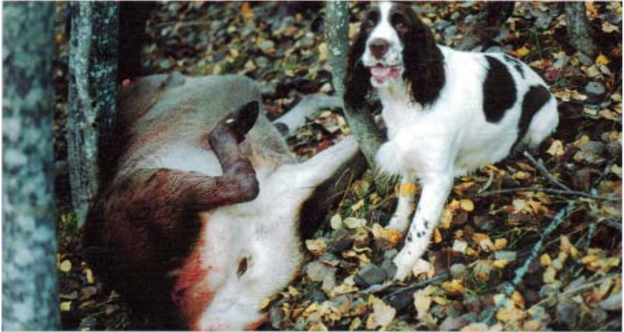
Som eftersökshund efter både småvilt och hjortvilt är springern i sitt esse

boll och pinnkastning. Ett gott råd är att alltid stanna med unghunden när den ska ut. Även om springern är knuten till dig med starka band ska du inte lära den att klara sig på egen hand.